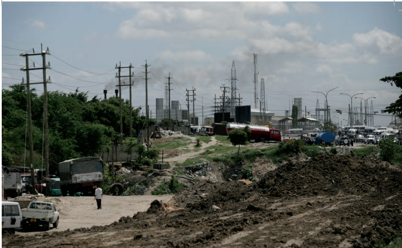
Afrika-szerte számos infrastrukturális beruházás ázsiai partnerséggel valósul meg

mítva – nem dúlnak államok közti háborúk. Enyhült az összezsugorodás súlyossága is, becslések szerint 1999-ben százezren veszítették életüket közvetlenül a harcok miatt, 2005-ben kevesebb, mint négyszázan. A határokat átlépő menekültek száma is csökkent: 1994-ben még majdnem 7 millióan éltek hazájukon kívül, 2007-ben már csak 2,5 millióan. De a kontinens nem csupán békésebb, liberálisabb is lett. A Freedom House – amely a világ összes országában méri a politikai szabadságot – indexértékei a Szaharától délre fekvő területen az elmúlt tíz évben jelentősen javultak.