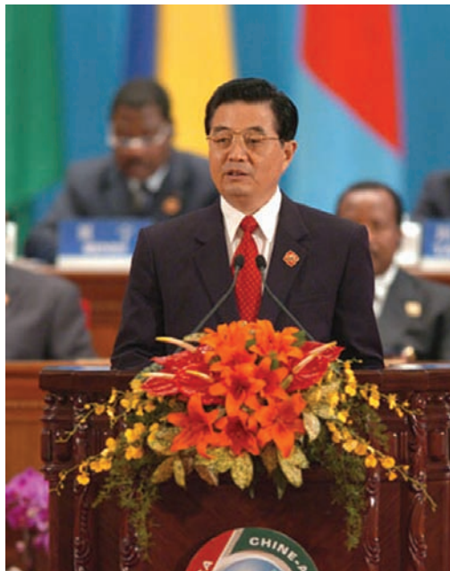
Hu Csin-tao kínai elnök köszönti a 2009-es Kína-Afrika Együttműködési Fórum résztvevőit az egyiptomi Sharm el-Sheikheben

A jótékony fellépésekben kétségtelenül benne van a maoista-kommunista szellemi örökség is: „segíteni a partnereken, a szegény testvéreken”, ezáltal tartósan megnyerni őket! (Afrika perifériális terere volt a hidegháború korszakának. A világháború