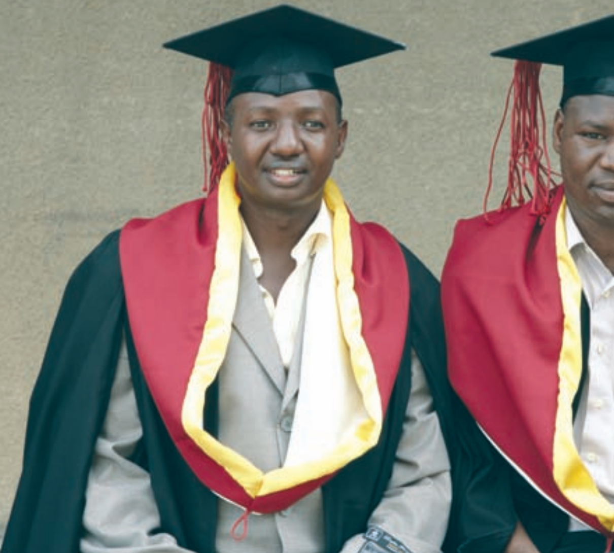
Végzett egyetemisták a Dar es-Salaam-i Egyetemen, 2006 - Maradnak - elmennek?

lások csupán nagyjából 15%-át teszik ki, a kivándoroltak jövedelmeinek ezen hazaküldött részei összesítve sok esetben önmagában értelmezhető gazdasági hatást képvisel. A számokat vizsgálva, és néhány leginkább érintett afrikai államot példaként hozva, a 2002–2007/08 közötti időszakban markáns változásokra figyelhetünk fel. Nigéria esetében a hazautalások volumene 2002-ben 1300 millió USD körül moz-