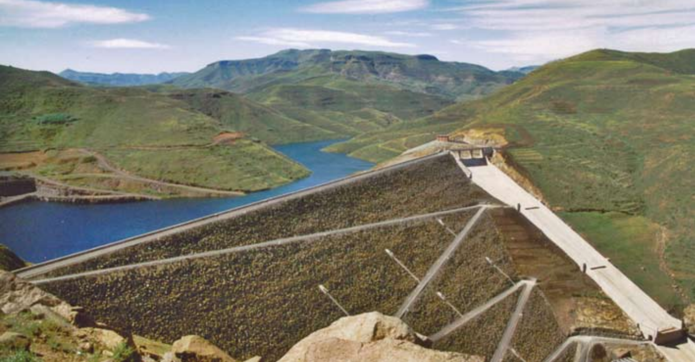
▲ Mohale gát

nivalóvá vált a régióban. A tapasztalatok szerint a vízzállítási beruházások jelentik a leggazdaságosabb megoldást, s ennek elfogadása vezetett az LHWP megvalósításához. Az első szakasz (1A és 1B) megépítése évente 30 millió dollár megtakarítást hozott Dél-Afrika vízfelhasználóinak.