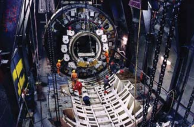
▲ A fűrőpajzs munkában