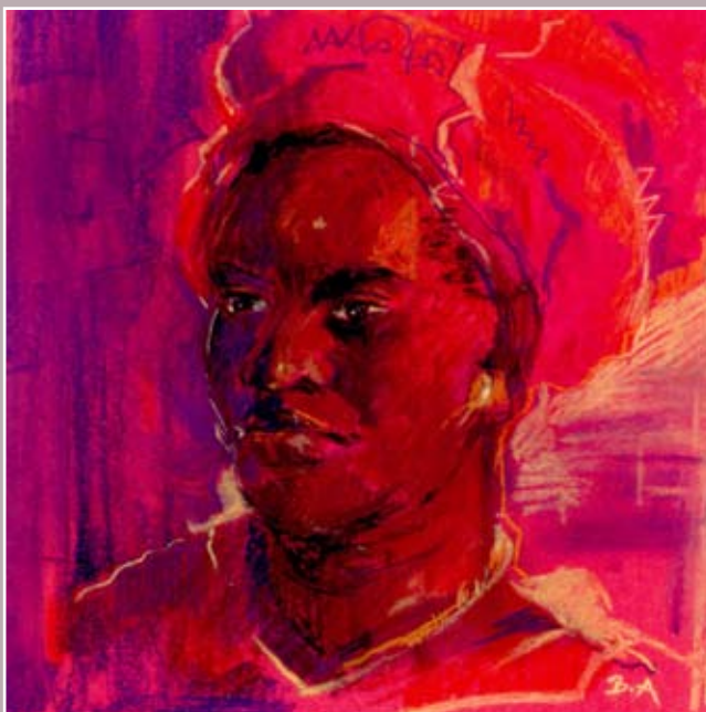
Nigériai nő portréja