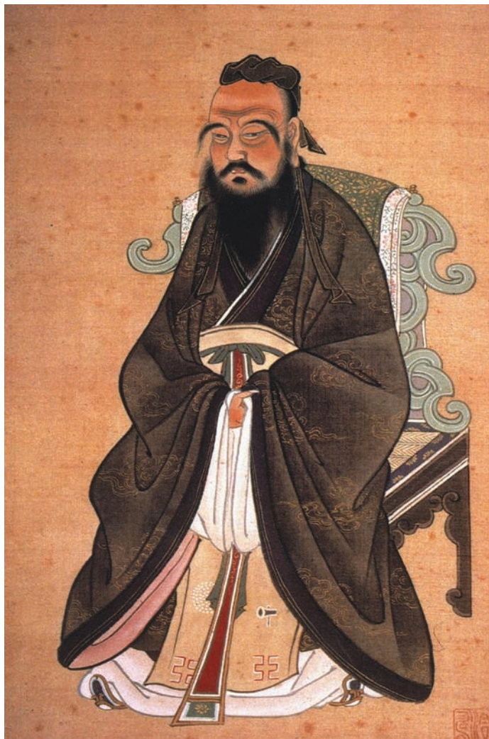
Konfuciusz, a mai kínai politikai kultúra egyik meghatározó filozófusa

A Pekingi konszenzus Cooper Ramo érvelésében három elméleti tételre épül: 1. Újrapozícionálja az innováció értékét. A legmarkánsabban élvonalbeli innovációra (például a száloptikára) van szükség a fejlődéshez, hogy olyan változást idézzünk elő, amely gyorsabban terjed, mint azok a problémák, amelyeket maga a változás hoz felszínre. 2. Azt rögzíti, hogy tekintettel arra, hogy a károszt felülről nem lehet menedzselni, egy sor új eszközre van szükség. E második tétel olyan fejlődési modellt követel, amely nem luxusként, hanem alapvető elvárásként kezeli a fenntarthatóságot és az egyenlőséget. 3. Egyfajta új biztonsági doktrínát jelöl azáltal, hogy az önmeghatározásra épít, és azt nyomatékosítja, hogy van esély – például összefogással – befolyásolni a hegemon hatalmakat, amelyek érezhetik annak a csábítását, hogy „rálépjenek a kisebbek lábujjára”. Kína felemelkedése világosan jelzi a nemzetközi rend átalakulásának új szakaszát. Ma „egyre döbbenetesebb technológia ugrás kibontakozásának vagyunk a tanúi [Kínában], ami előrevetíti a feltartóztathatatlan gazdasági – s a további hatalmi – súlypont-átrendeződést [a nemzetközi rendszerben]. ... S ez még csak a kezdet, a „Nagy Sárkány” még messze van a teljes sebességtől.” 6