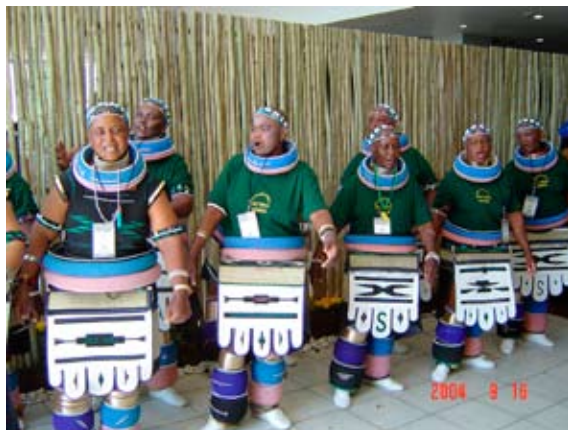
Ndebele táncosok

Jacob Zuma, az „ellenzéki” jelölt, későbbi győztes ugyanakkor nem tűnik a legalkalmasabbnak e posztra. A választás előtt hiába tett ázsiai, amerikai és európai körutat, hogy megnyugtassa a külföldi tőkét és eloszlassa félelmeiket gazdaságpolitikai meggyőződését illetően, kötődése – és függése – az ANC szélsőbal szárnyához eltérítheti nemzetközi közösség által elvárt közepes politikától, mely Mbekit kétségkívül jellemzi. Nem jó ajánlólevél számára a fegyvervásárlással kapcsolatos korrupciós vizsgálat és a bírósági tárgyalás sem, mely miatt 2005-ben már lemondatták helyettes államelnöki tisztségéről, közvetlen üzletársát, pénzügyi tanácsadóját, Shabbir Sheiket pedig jogerősen ötévi szabadságvesztésre ítélték. Egyúttal aláhúzóandó, hogy Zuma AIDS-fertőzéssel kapcsolatos könnyelmű magatartása sem jelez sok jót.