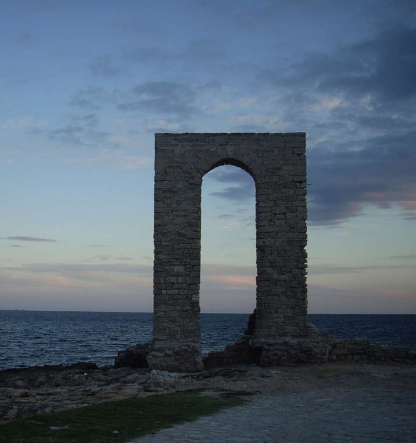
Az egykori védőfal nyomai a mahdiai földnyelv és öböl körül az Fátimida-dinasztia korát idézik.

ne tunéziai iwiw, valószínűleg mindenki alapértelmezett fényképe az egykori államfő nyughelye előtt, vagy karosszékeben ülve készülne.