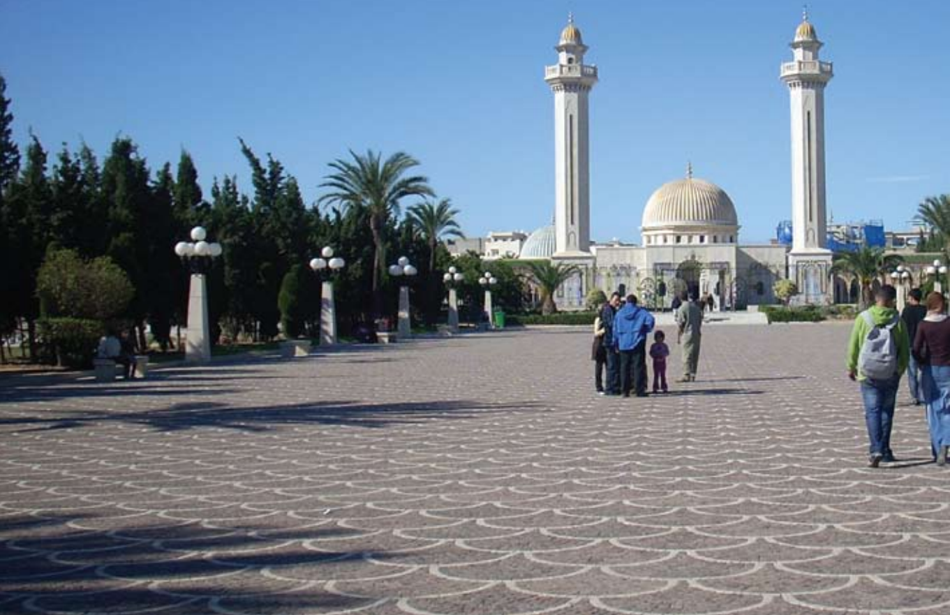
Szépség és monumentalitás a monastiri temető közepén. Széles út visz Habib Bourguiba mauzóleumához, amely személyes tárgyainak gyűjteményével az államférfinek állít emléket

A fiatalokat már „megfertőzte” a nyugat, ami a ruházkodásban, zenehallgatásban is megjelenik. Ezzel párhuzamosan, egyfajta önazonosság keresés is megfigyelhető. Korábban Bourguiba több dolog mellett megtiltotta, hogy a nők fátylat viseljenek. Az arab identitás a fiataloknál a nyugati ruhák, mint a baseball sapka és a kapucnis pulóver párosítása a hagyományos arab – vagy másik ismert nevén: palesztin – kendővel és a fátyol újbóli térhódítása. A telefonfülkék mellett egyre több a mobiltelefon, a terek pedig a letöltött, kihangosított arab zenétől hangosak. A fiúk minden lehetséges területet, köztük a mecsetek előtti tereket is, elfoglalnak, ahol futbalozni tudnak. A közösségi élet és az összetartozás fontossága jelenik meg a sportban, kávézóknak, mecsetekben.