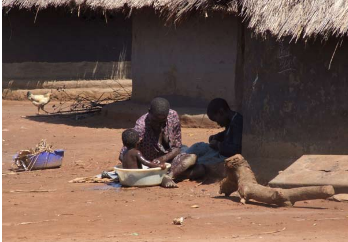
Fürdetés a táborban

Néhány percre megállok egy sarokban, és csak figyelem az eseményeket. Csodálattal és tisztelettel tölt a gyermekanyák lelkesedése, öröme. Érezni lehet a levegőben a hálát, a boldogságot és a reményt. Végre valami történik. Végre valaki segít nekik, hogy szörnyű múltjukat elfeledhessék. Mindenki büszkén viseli a fekete IGAP-pólóját, a lányok haja szépen lefonva, néhányuknak rövidre vágva. A gyerekeken is „legszebb” ruhájuk, melyek ugyan kissé szakadtak, de makulátlanul tiszták. Hiába, a mérhetetlen szegénységet nem lehet elrejtteni.