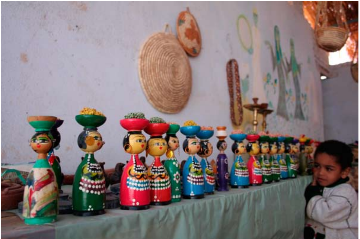
Bakkarok, azaz Bakkarról, a anúbiai rajzfilmhősről elnevezett fa szobrocskák turistáknak