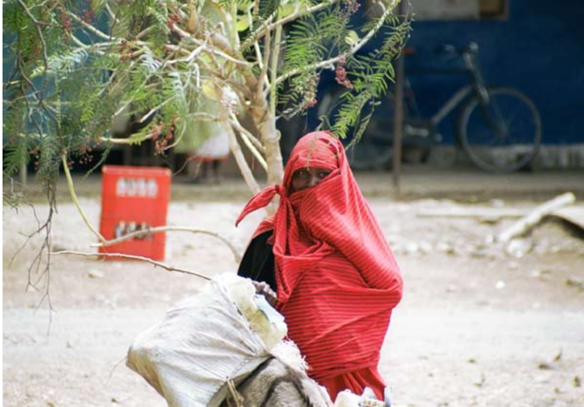
Maszáj nő

A 10. EDF a 2008-2013-as periódusra 22,7 milliárd eurót szán világszerte a fejletlen területek támogatására. Ennek az összegnek a 90%-a a szubszaharai Afrikát illeti, és célja a stratégia gyakorlati megvalósítása regionális szinten. (Brown 2002)