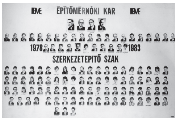
▲ Végzősök tablója.