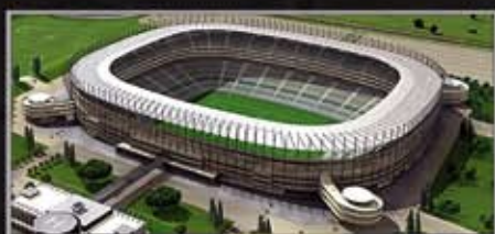
Johannesburg, Soccer City