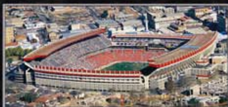
Johannesburg, Ellis Park