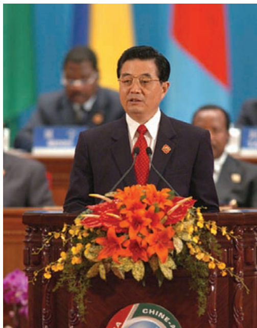
Hu Csin-tao kínai elnök köszönti a 2009-es Kína-Afrika Együttműködési Fórum résztvevőit az egyiptomi Sharm el-Sheikhben

A jótékony fellépésekben kétségtelenül benne van a maoista-kommunista szellemi örökség is: „segíteni a partnereken, a szegény testvéreken”, ezáltal tartósan megnyerni őket! (Afrika perifériális terere volt a hidegháború korszakának. A világháború