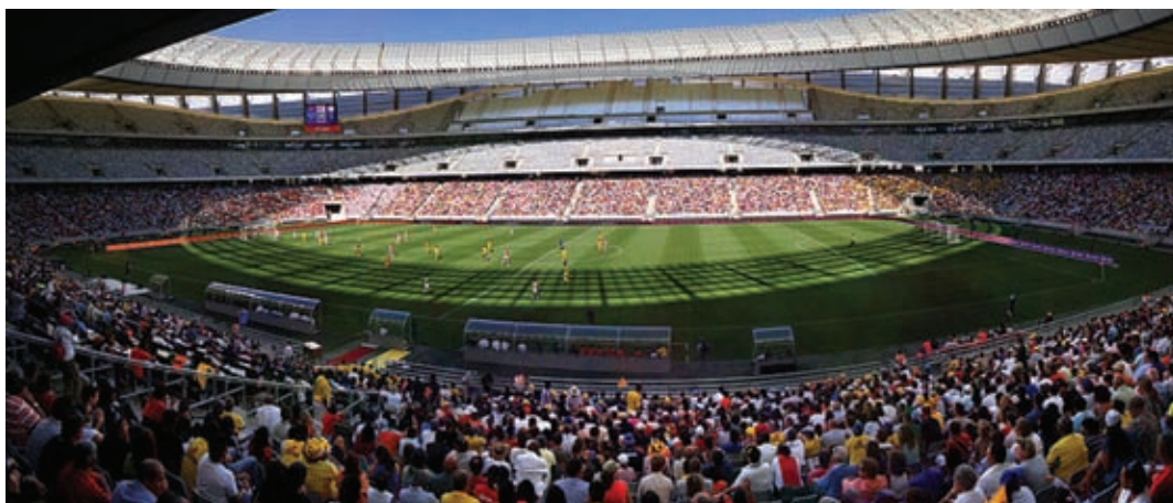
A fokvárosi stadion az avató-mérkőzésen.