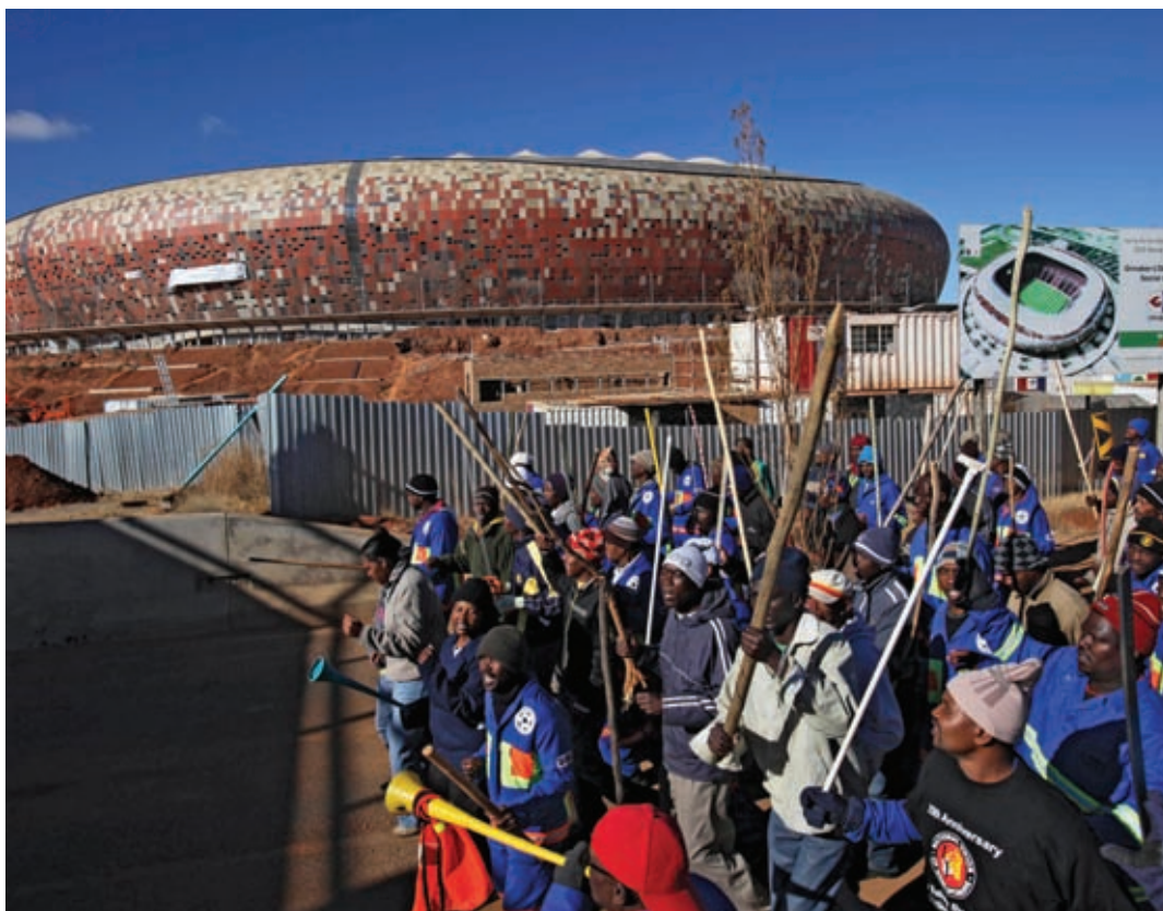
Újabb sztrájk a Futballváros mellett

kolói érdeklődés. Ezzel szemben úgy nézett ki, az idei esemény nem vonz annyi nézőt. Persze sok tényező közrejátszhat ebben (gazdasági válság, a helyszín, a közbiztonságról szóló ijesztő hírek, a jegyek magas ára), mindenesetre lehangelő látvány lenne, ha üresen konganának a felújított vagy felépített stadionok.