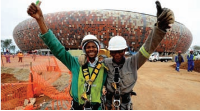
Boldog munkások, ingyenjegyet kaptak

nagy futballkultúrájú országban kerül megrendezésre az esemény, mint láthattuk 2006-ban Németország példáját, ahol kétszer nagyobb stadionokat is meg lehetett volna tölteni a szurkolókkal.