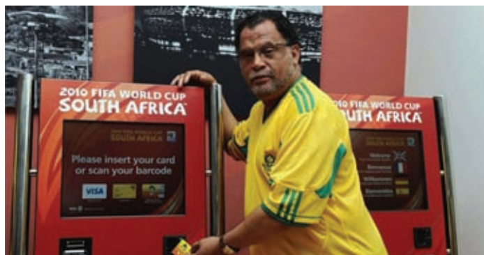
A jegyautomaták

A jegy-mizériát egy 2009-es FIFA sajtónyilatkozat indította el, noha akkor még nem tudhatuk, hogy a hírek mögött egészen más tények állnak. Az áprilisban kikerült anyag szerint a július 11-én sorra kerülő johannesburgi finálén kívül a nyitómérkőzésre és a két elődöntőre sem lehet már belépőt kapni. Teltházat jelentettek továbbá a vb-nek otthont adó városok közül Fokvárosban, Nelspruitban és Pretoriában. A hatalmas érdeklődés miatt a szervezők leállították a csapatbérletek árusítását Brazíliában, Ang-