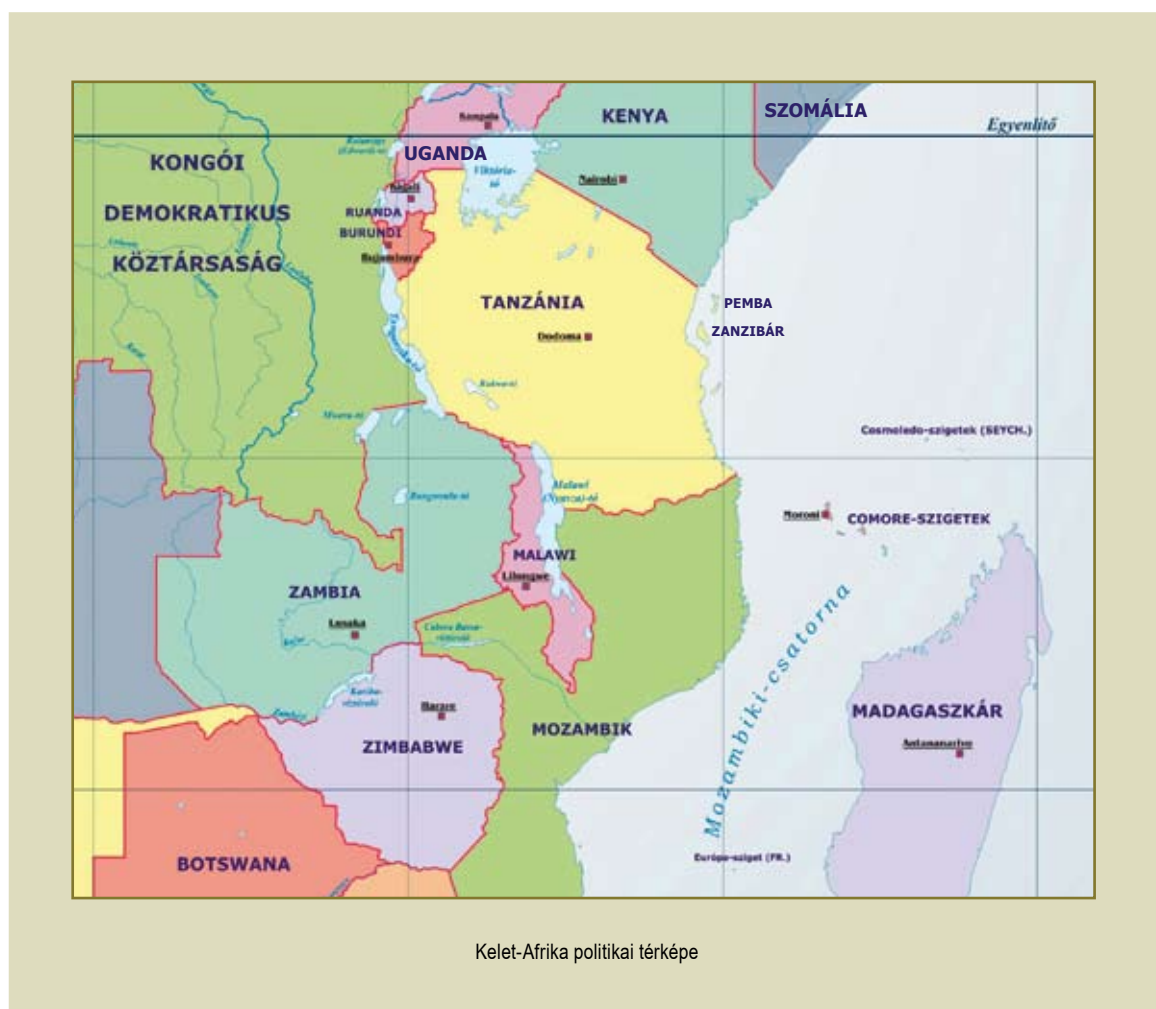
Kelet-Afrika politikai térképe

A Kelet-afrikai Közösség életében és fejlődési lehetőségeiben a gazdasági szempontok dominanciája kezdetektől fogva tetten érhető, és a kapcsolatok legalapvetőbb mozgatórugóként értelmezendő. Mielőtt azonban a Közösség elmúlt négy évtizedét vizsgáljuk meg részleteiben, vessünk egy pillantást az EAC-t alkotó három államra.