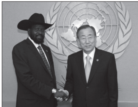
Salva Kiir és Ban Ki Mun.

A déli kormány, az egyház és a civil szervezetek számára a legnehezebb feladat a nép túl magas elvárásainak helyes kezelése lesz. A dél-szudániak évtizedek óta várnak erre a pillanatra. Legtöbben úgy