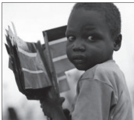
Jubai kisfiú zászlókat tart.

Az ENSZ, az USA és Juba szövet- ségesei a referendum időben való meg- tartása mellett is lándzsát törnek, hiszen Peter Adwok Nyaba, a szudáni felsőok- tatási és kutatási miniszter nyilatkozata szerint a referendum elhalasztása veszé- lyesebb a háborúnál.