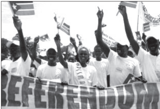
Megmozdulás a referendumért.

Szudán olajexportáló ország, napi kb. 500 ezer hordó kitermeléssel. A jelentős mennyiségű ismert olajkészlet (6.3 billió hordó) csaknem 75%-a Dél-Szudán területén található. Kartúm bevételének mintegy 60%-a az olajexportból származik.