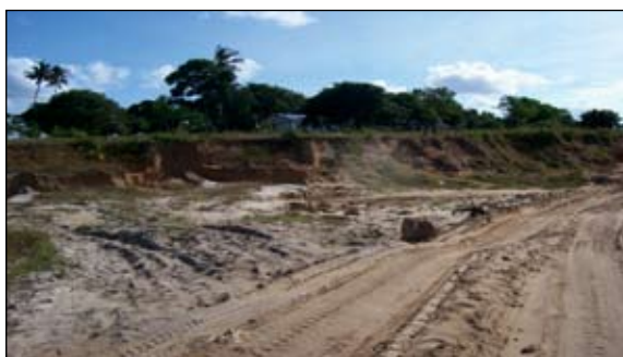
2. kép • Homokbányászat egy mbandei alsó tagozatos iskola közelében