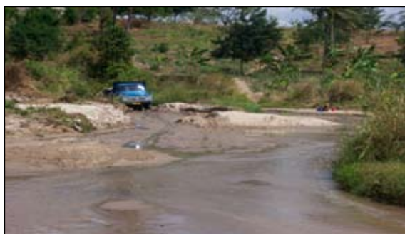
3. kép • Homokbányászat a Kibwergere folyón (Kibamba)