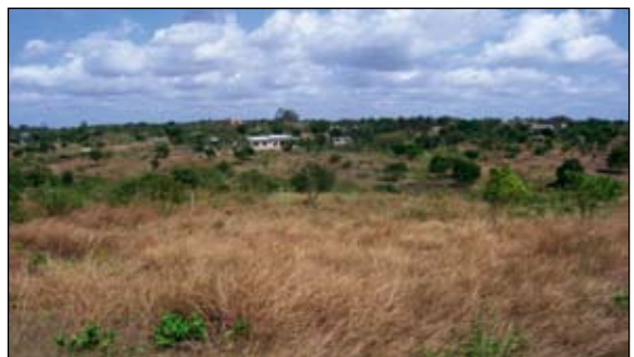
1. kép • A földművelésből kivont földterület Kibamba faluban

E llis szerint (1998) a megélhetési források sokfélesége olyan folyamat, amelyben a családok a tevékenységek és szociális lehetőségek változatos skáláját hozzák létre életszínvonaluk javítása érdekében. A változatosság vagy a tevékenységek növekvő sokféleségére utal, vagy pedig az olyan hagyományos mezőgazdasági szektorokról, mint például a földművelésről a nem hagyományos tevékenységekre való áttérésre. Számos újabb keletű tanulmány hangsúlyozza az