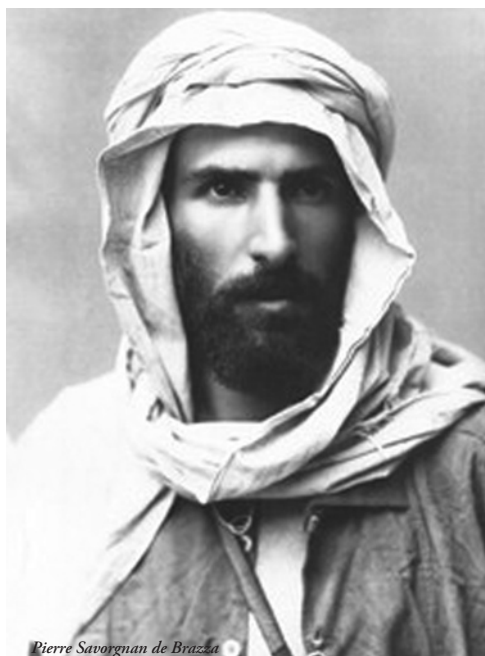
Pierre Savorgnan de Brazza

jével, a Makokoval, I. Iloy-jal aláírt Franciaország javára egy protektorátusi szerződést. A Makokot egyfelől kereskedelmi érdekei, másrészlől riválisainak gyengítése vezette a megállapodás szentesítésére. (Téké riválisai egy évvel később a brit Stanleyvel írtak alá egy barátsági szerződést a Kongó folyó bal partján, s ezzel kivonták magukat a Makoko és Franciaország fennhatósága alól).