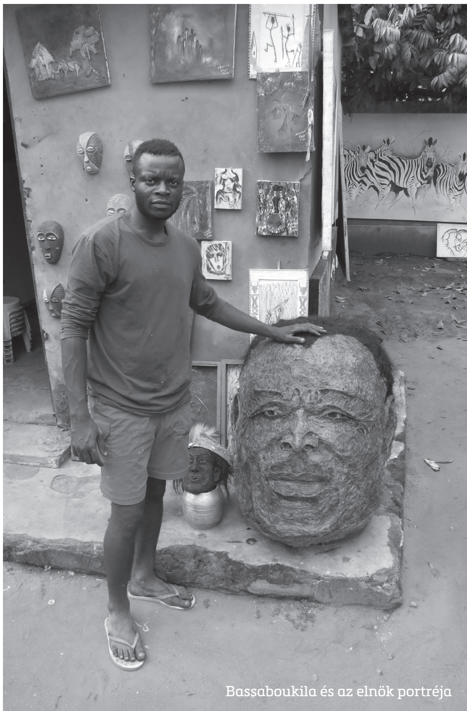
Bassaboukila és az elnök portréja