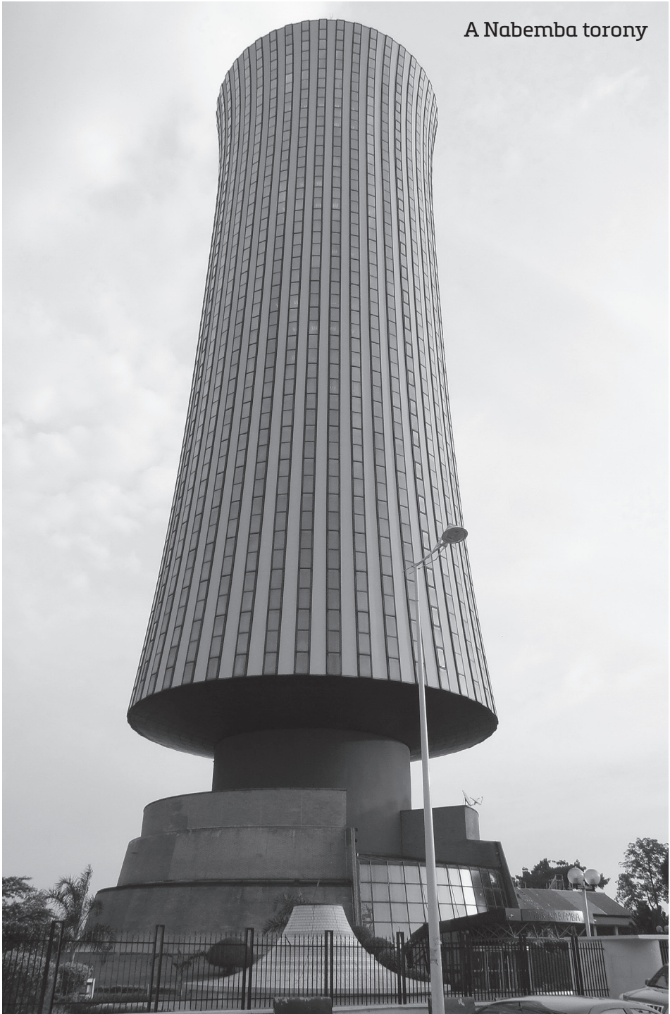
A Nabemba torony