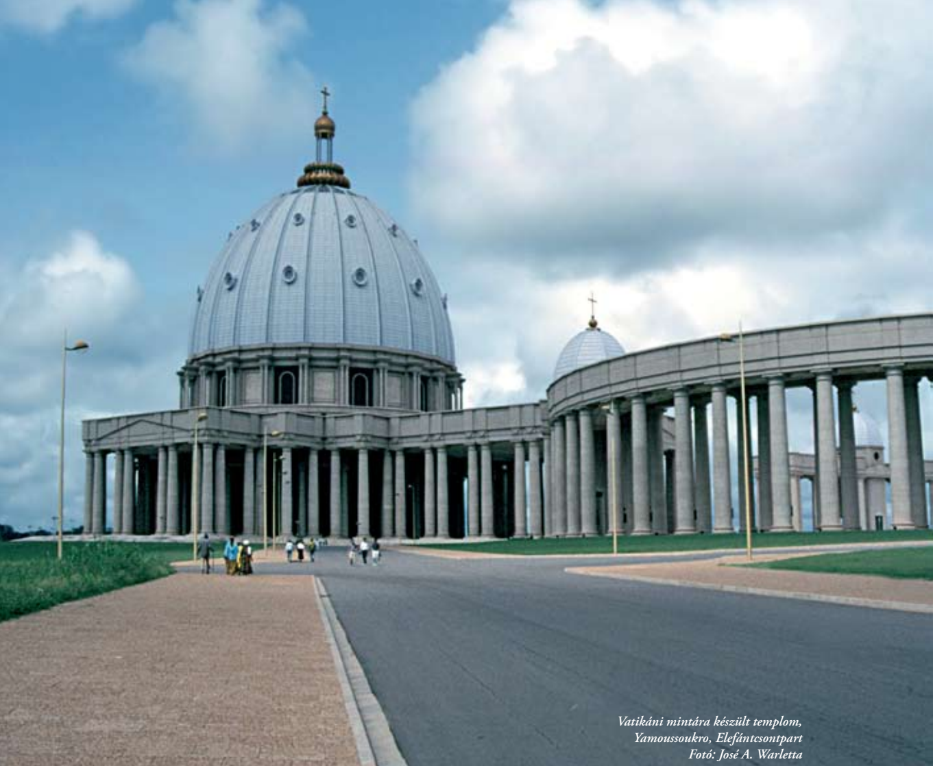
Vatikáni mintára készült templom, Yamoussoukero, Elefántcsontpart

ősök (living dead) 7 animista, totemista tisztelete jellemzi. Mindezek a jó, vagy rossz szellemekkel állnak kapcsolatban, menedéket nyújtva számukra. A szellemek létezése általánosan elfogadott, vannak közöttük olyanok, akiket az istenek már eleve szellemnek teremtettek, illetve olyanok, akik valaha emberi lények voltak. (Mbiti, 1976: 101) A rontást elkerülendő a szellemek számára évente, vagy meghatározott időközönként ajándékokat, engesztelő áldozatokat kell felajánlani, hiszen az elfeledett lényeket a többi kigúnyolhatja, amit azok az emberek torolhatnak meg. Az elhunytak szellemei között elsősorban a haláluk időpontja tett különbséget. Az őstiszteletnek a közösségek összetartozás-érzésében is meghatározó szerepe volt. Számos kutató a hagyományos afrikai vallások közös jellemzőjeként említi a szakrális terek hiányát is, pontosabban azok korlátok nélkülségét. (Füssi, 2005: 36)