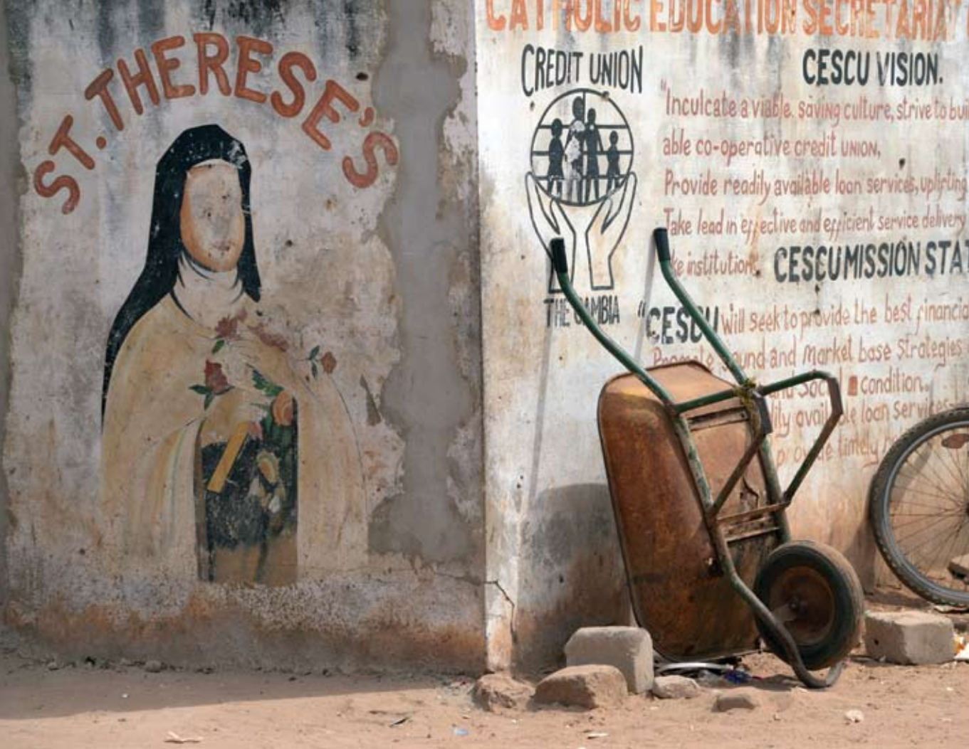
Utcai graffiti, Tanzánia

megművelt területek egyharmada egyházi birtok volt. A Vörös-tenger menti oszmán térhódítás nemcsak a tengerparti kijárástól vágta el az országot, hanem a keresztény törzsterület északi részétől is. A ma Eritreához tartozó, ősi keresztény kolostorokkal tarkított területért a 19. századi Abesszínia Egyiptommal és Olaszországgal, a 20. század során pedig Etiópia Olaszországgal és Eritreával keveredett számos alkalommal konfliktusba, míg a 21. század szintén etióp–eritreai háborúval indult.