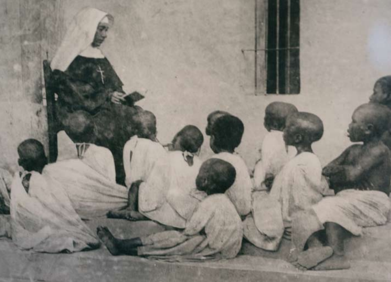
Missziós oktatás egy régi fényképen, Tanzánia

századra a kereszténység, akárcsak maga Kongó állam is, jelentéktelenné zsugorodott Afrikában. A földrész nyugati partvidékén sehol sem tudták a lakosságot tömegesen megtéríteni a portugálok, kivételt csupán a környező szigetek képeztek. A Zöld-foki-szigetektől Fernando Póo-ig az összes sziget lakossága kereszténnyé lett még a portugál hódítás első századaiban.