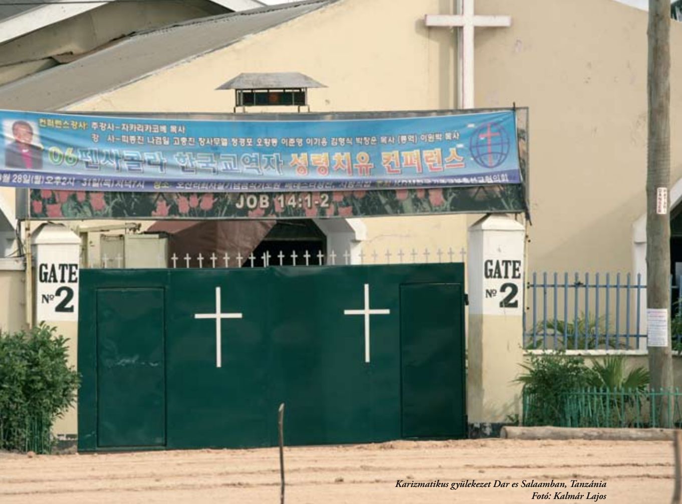
Karizmatikus gyülekezet Dar es Salaamban, Tanzánia