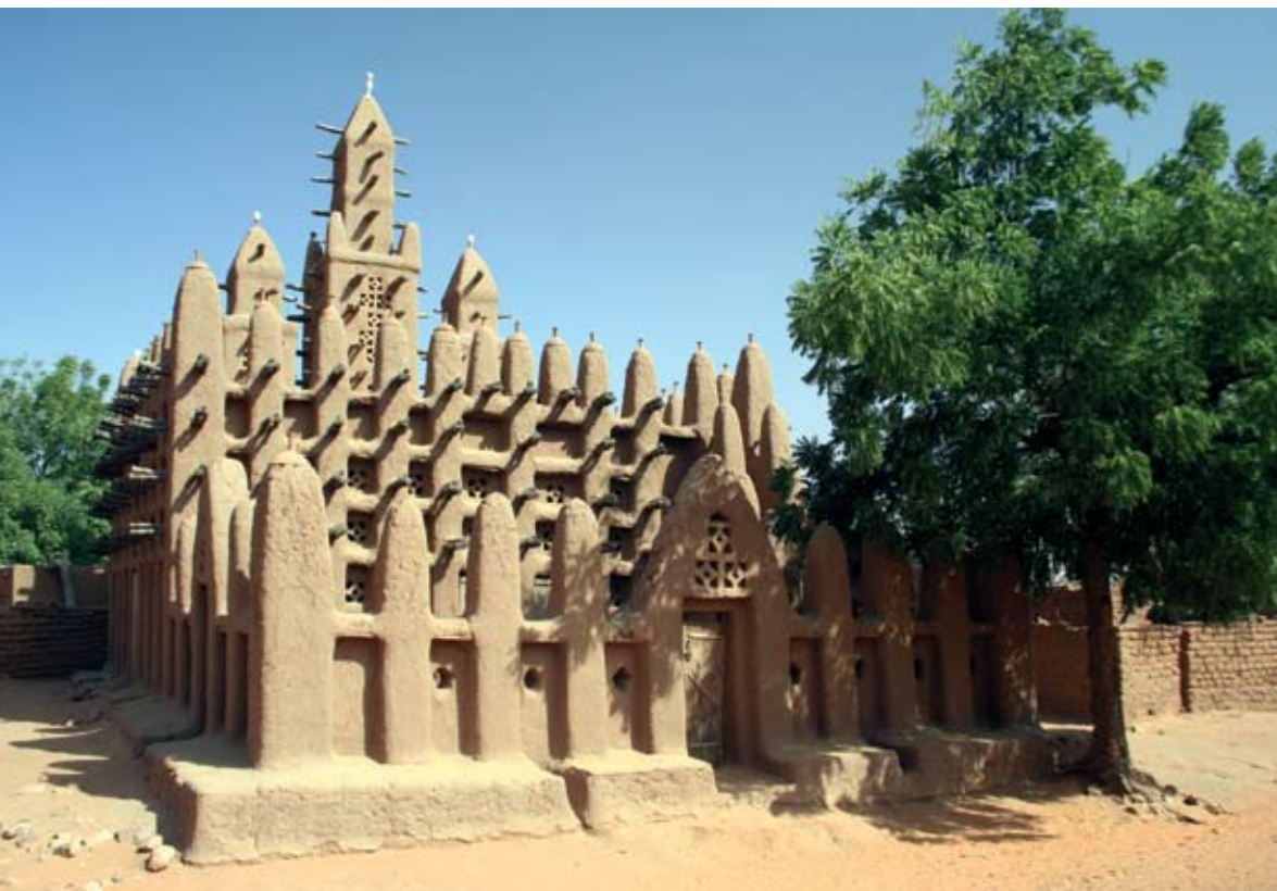
Mecset Téliiben, Mali

reskedők Pemba szigetén, tíz évvel később pedig a szomáli partvidéken létesítettek telepeket. Muzulmánok jöttek az Arab-félszigetről, de Perzsiából és Indiából is. Leginkább a partvidék menti kisebb-nagyobb szigeteket népesítették be. Az afrikai rabszolgákkal egészen Kínáig kereskedtek, a Zambézi vidékéről a 10. századtól exportáltak aranyat. A rendkívül nyereséges kereskedelem gazdag életet biztosított a muzulmán kereskedők számára. Az arab, perzsa, indiai és helyi afrikai elemekből létrejött szuahéli civilizáció az iszlám felvirágzását eredményezte a kelet-afrikai partvidéken.