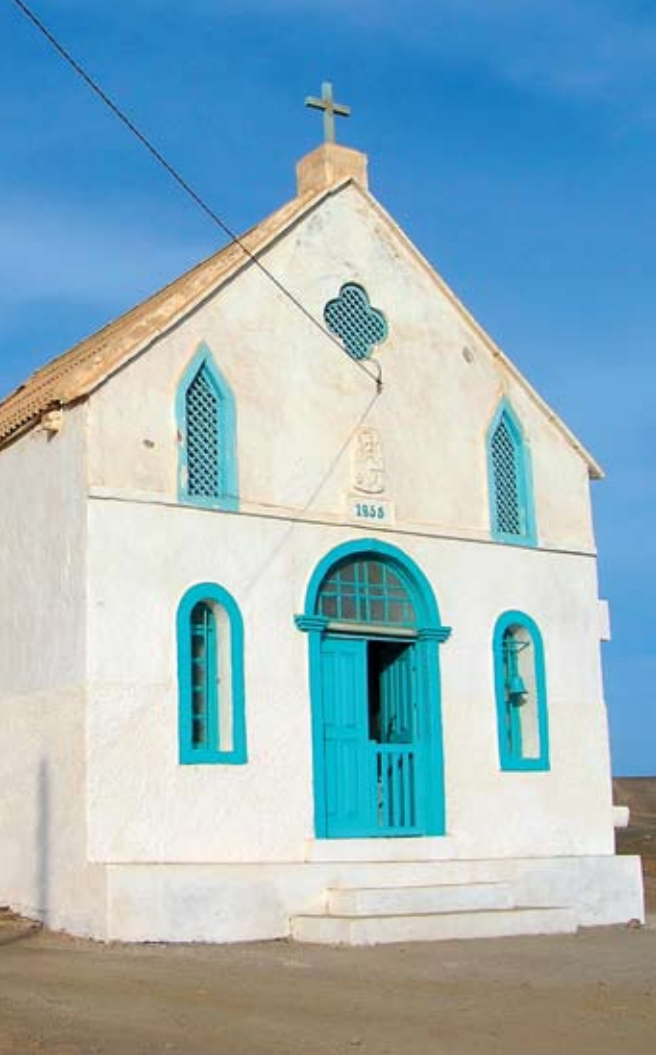
Templom a Zöldfoki-szigeteken