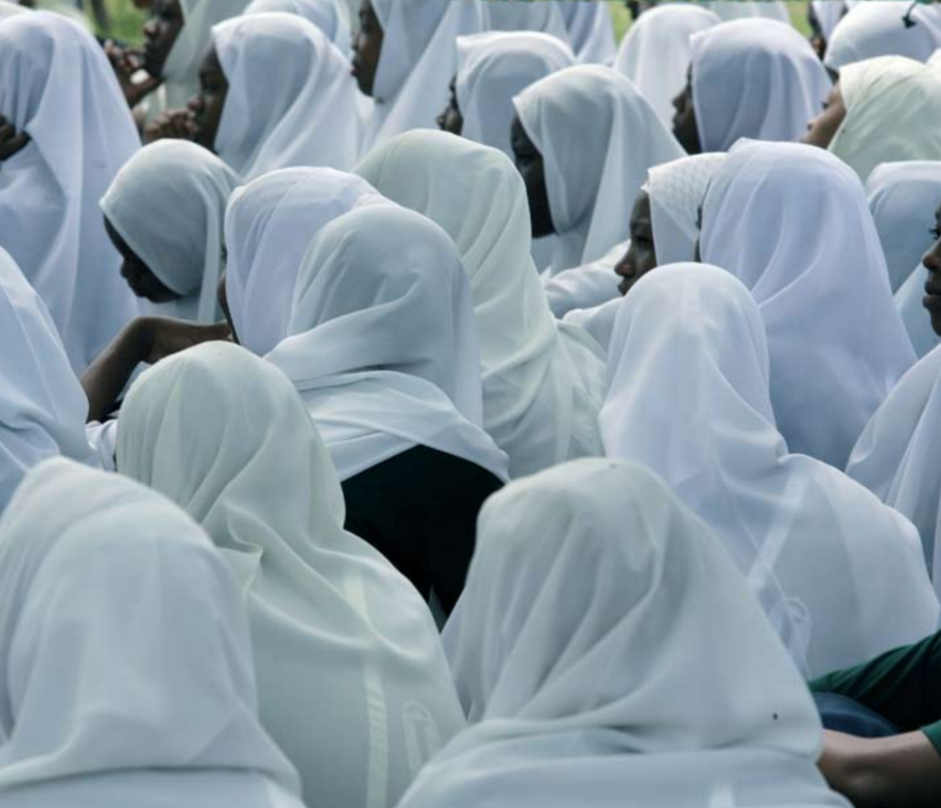
Muszlim lányok környezetvédelmi napon vesznek részt Stone Town-ban, Zanzibár, Tanzánia