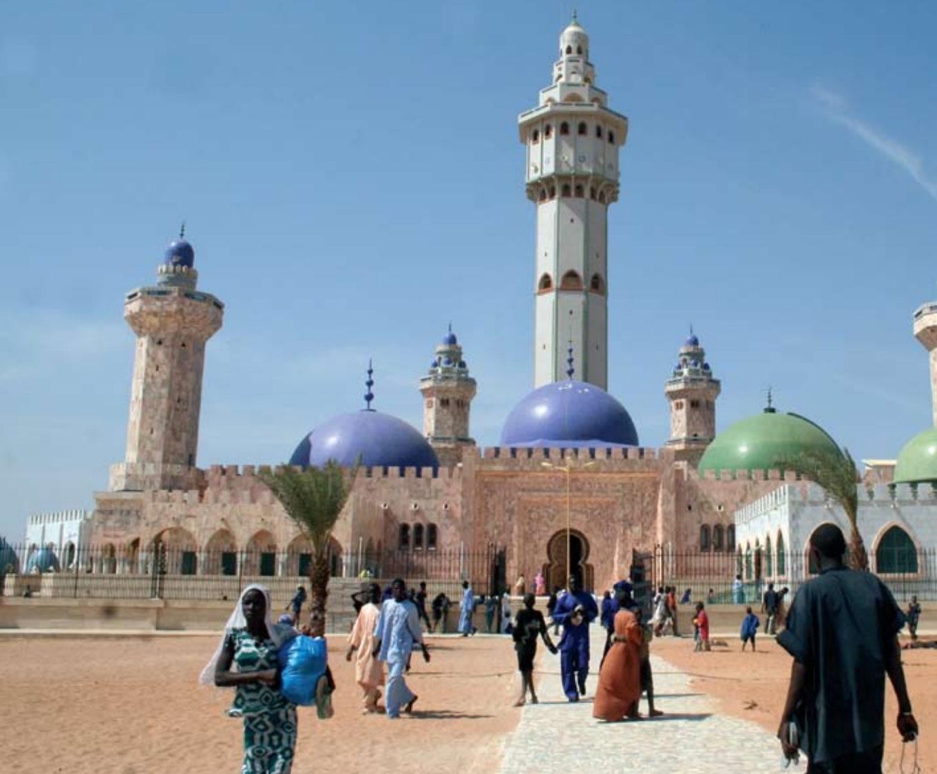
A toubai mecset, Szenegál

reszténység hasonló ütemű terjedése, e vélekedés azonban zsákutcába vezetett, hiszen a keresztény misszionáriusoknak sehol sem sikerült jelentősebb számban muzulmánokat áttéríteniük, így az iszlám korszakát követően nem jött el a kereszténység ideje. 16