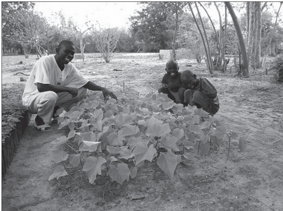
Biüzemanyag alapanyagként használatos kurkasfa palánták.

Míg tehát az élelmiszer-kereslet egyre jobban növekedik, a kínálat nem biztos, hogy ezzel lépést tud tartani, főleg ha a bioüzemanyagok előállításához szükséges nyersanyagok termesztése élelmiszer-célú mezőgazdasági termelést szorít ki. A mezőgazdasági termelésbe új területek bevonása sokszor nehézségekkel jár, gyakran például erdő-