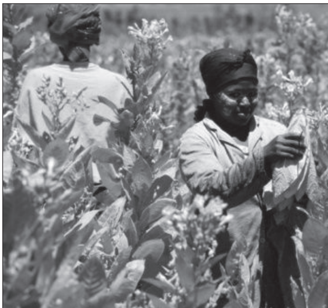
Nő egy dél-afrikai dohányültetvényen.

Noha valamennyire érthető, hogy a kormányzatnak szüksége van pénzre, és így kecsesítőek számára a külföldi befektetők ajánlatai, mégis inkább a helyi lakosság életminőségét és ellá-