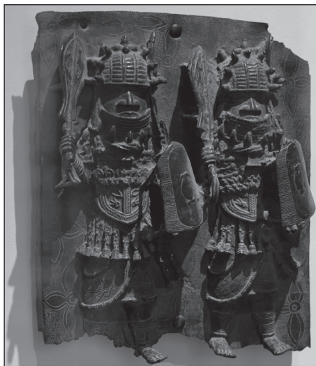
Benini harcosokat ábrázoló bronz plakett

lissá lett, a protektorátus intézményének megtartása hosszú távú következményekkel járt. Az európai jogban a protektorátusi státusz sok mindent jelenthetett, a legáltalánosabb jellemzője mégis az volt, hogy a fennhatóságot gyakorló hatalom a szuverenitás néhány elemét magához vonta. Ez az európai gyakorlatban főként a pénzügyek és a külügyek irányítását jelentette. Zanzibár földrajzi helyzeténél fogva a britek számára India külső biztonsági övezetéhez tartozott. Már 1822-ben az ún. „Moresby szerződés” 27 révén a szultán engedményekre kényszerült, elsősorban arra, hogy keresztény országokba nem ad el többé rabszolgákat. A rabszolga-kereskedelem teljes betiltását a britek egy 1873-as újabb szerződésben kényszerítették ki, ami gazdaságilag jelentősen meggyengítette Zanzibárt. Mindinkább a brit konzulok és a brit flotta határozta meg a szigeten az ügyeket, Zanzibár nem hivatalos miniszterelnökeivé váltak anél-