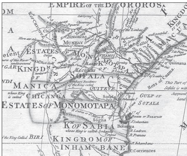
Monomotapa Királyság egy régi térképen

A 14. századtól fennálló Kongó királyság területe azonban a 16. századtól az európai rabszolga-kereskedelem egyik legfontosabb forrásává vált, s ez a birodalom elnéptelenedéséhez és szét-