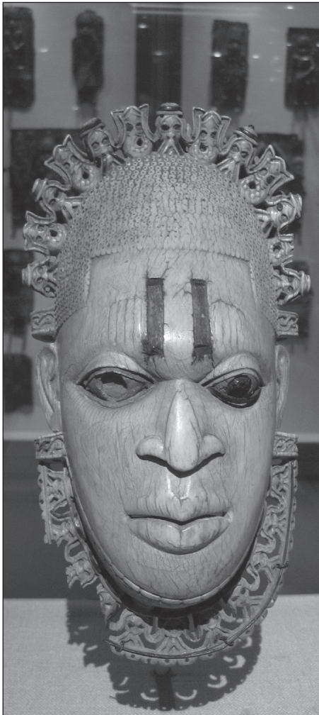
Elefántcsont maszk a 16. századi Beninből

a mai Szudán teljes területét, örökletes alkirályságot hozva itt létre. Az egyiptomi fennhatóság ezen a területen egészen az 1880-as évek elejéig, a mahdista felkelésig fennmaradt. Mohammed Ali egyben az iszlám új, energikus képviselője és megújítója is volt Egyiptomban, az enervált török vallási uralommal szemben. Modernizációs kísérle-